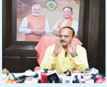
रायपुर (प्रतिदिन राजधानी)