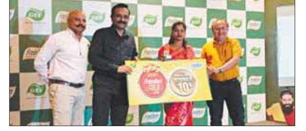
लीटर पाउच खरीदने थे।

देश के अग्रणी खाद्य तेल ब्रांड फ्रीडम हेल्दी कुकिंग ऑयल्स ने छत्तीसगढ़ के लिए 'गो फॉर फ्रीडम गोल्ड ऑफर' के बंपर ड्रॉ के विजेताओं की घोषणा कर दी है। इस योजना के तहत, एक भाग्यशाली विजेता को 50 ग्राम का गोल्ड कॉइन और दो विजेताओं को 10 ग्राम के गोल्ड कॉइन प्रदान किए गए हैं। 'गो फॉर फ्रीडम गोल्ड ऑफर 2024' को उत्सव के माहौल में उपभोक्ताओं से जुड़ने के उद्देश्य से पेश किया गया था। यह योजना कर्नाटक, आंध्र प्रदेश, तेलंगाना, ओडिशा और छत्तीसगढ़ में लागू की गई थी। इन राज्यों में 100 उपभोक्ताओं ने रोजाना 1 ग्राम सोना जीता और साथ ही बंपर ड्रॉ में भाग लेने का मौका भी मिला। इस ऑफर में भाग लेने के लिए गाइडों को फ्रीडम रिफाइंड सनफ्लावर ऑयल के दो 1-