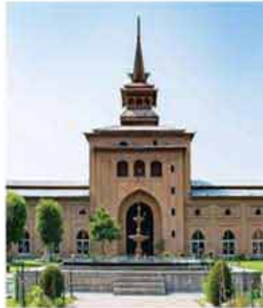
जामा मस्जिद, आगरा

ताज महल के लिए मशहूर आगरा अपनी जामा मस्जिद के लिए भी जाना जाता है। यहां मौजूद यह मस्जिद देश की बड़ी मस्जिदों में शुमार है। इसे शुक्रवार मस्जिद के रूप में भी जाना जाता है। यह मस्जिद भी लाल बत्तुआ पत्थर और सफेद संगमरमर से बनाई गई है।