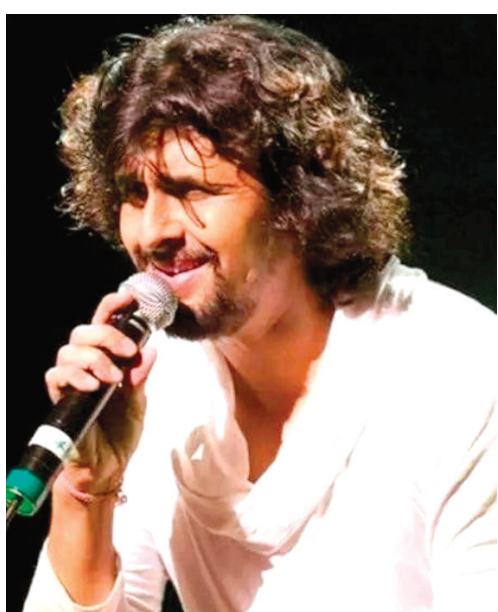
सोनू निगम के खिलाफ हुई थी एफआईआर दर्ज