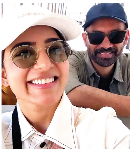
उनकी पहली फिल्म होगी। इसी की तस्वीरें उन्होंने अपने सोशल मीडिया पर शेयर की हैं। यह फिल्म 9 मई को रिलीज होने वाली है।

सामंथा रुथ प्रभु इन दिनों फिल्म शुभम का जोर-शोर से प्रमोशन कर रही हैं। यह बतौर प्रोड्यूसर