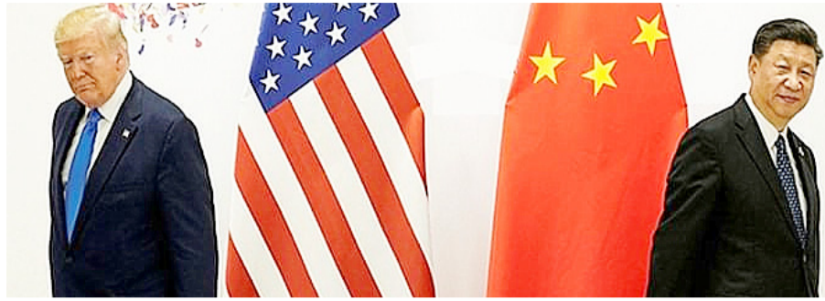
साझेदारों पर जवाबी टैरिफ लगाने के एलान के बाद चीन के साथ उसका व्यापार युद्ध एक नए मुकाम

अमेरिका की ओर से 2 अप्रैल 2025 को अपने व्यापारिक