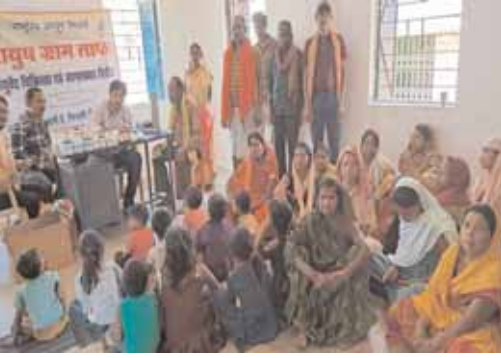
स्व-सहायता समूहों और जन प्रतिनिधियों को भागीदारी से स्वास्थ्य जागरूकता को जलाने का रूप दिया जा रहा है।

ग्रामीण स्वास्थ्य सेवाओं को मजबूती देने की दिशा में आयुष मंत्रालय ने एक महत्वपूर्ण पहल करते हुए 'आयुष ग्राम' योजना की शुरुआत की है। इस योजना का उद्देश्य ग्रामीण जनता को आयुष आधारित समग्र स्वास्थ्य सेवाएं उपलब्ध कराना है, जिससे न केवल बीमारियों से लड़ने की शक्ति बढ़े, बल्कि निरोग जीवनशैली को भी बढ़ावा मिले। राष्ट्रीय आयुष मिशन के तहत छत्तीसगढ़ राज्य में प्रथम चरण में 146 ग्रामों को 'आयुष ग्राम' के रूप में चिन्हित किया गया है। इन ग्रामों में आशा कार्यकर्ताओं, आंगनवाड़ी कार्यकर्ताओं, स्कूल शिक्षकों,