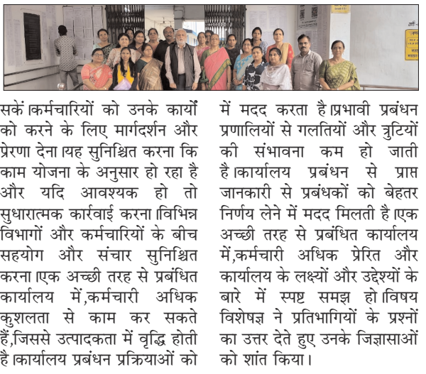
सकें कर्मचारियों को उनके कार्यों को करने के लिए मार्गदर्शन और प्रेरणा देना (वह सुनिश्चित करना कि काम योजना के अनुसार हो रहा है और यदि आवश्यक हो तो सुधारत्मक कार्रवाई करना (विभिन्न विभागों और कर्मचारियों के बीच सहयोग और संचार सुनिश्चित करना (एक अच्छी तरह से प्रबंधित कार्यालय में, कर्मचारी अधिक कुशलता से काम कर सकते हैं, जिससे उत्पादकता में वृद्धि होती है (कार्यालय प्रबंधन प्रक्रियाओं को