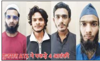
गुजरात एटीएस ने अलकायदा के चार आतंकी गिरफ्तार की हैं।

गिरफ्तार किया गये सभी आतंकियों की उम्र 20 से 25 साल बताई जा रही है। सभी आरोपी एक दूसरे से सोशल मीडिया से कनेक्ट होते थे। सूत्रों से मिली जानकारी के मुताबिक सभी आतंकी अलकायदा से जुड़े हुए हैं।