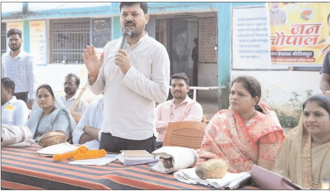
विधायक को अपनी समस्या बताया कि विगत 30 साल से मांग कर रहे हैं आज परसदा- मोतिमपुर खुर्द कि रोड बहुत तक पुरा नहीं हो पाया। उक्त रोड को बनाने पूरा का प्रस्ताव विधायक ने तुरंत प्रस्ताव भेजा। ग्राम आलेसुर में बच्चों कि समस्याओं को सुनते हुए शाला में प्रार्थना शोड, किचन शोड, शौचालय का घोषणा भी