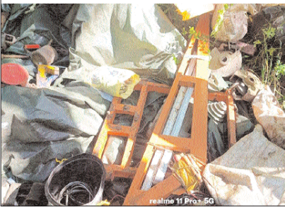
अन्य सह उपकरण तथा भारी मात्रा में विस्फोटक सामग्री का एक बड़ा डम्प बरामद किया गया।

बीजापुर, प्रतिदिन राजधानी जिले के उस्तर थाना क्षेत्र के ग्राम गुंजेपती के जंगलों में सुरक्षा बलों ने नक्सलियों की बड़ी साजिश को नाकाम करते हुए भारी मात्रा में विस्फोटक सामग्री और उपकरण बरामद किए हैं। यह कार्यवाई संयुक्त रूप से कोबा 205, केरिपु 196 यंग प्लाटून बस्तरिया, और केरिपु 229 द्वारा की गई। सूत्रों के अनुसार एफओबी गुंजेपती क्षेत्र में चलाए गए तलाशी अभियान के दौरान जंगलों में छिपाकर रखे गए हथियार व विस्फोटक तैयार करने के उपकरणों और