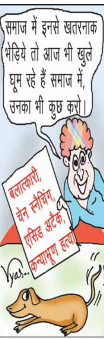
बलाकारी, चैन स्नैचिंग, एमिड अटैक, कन्याभ्रूण हत्या

बता दें कि रेड्डी कथित तौर पर साल 1996 में केंद्रीय रिजर्व पुलिस बल (एनफ़ोर्स) में भर्ती हुए थे और जम्मू-कश्मीर में एक कमांडो के घर