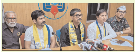
रायपुर ( प्रतिदिन राजधानी )

उप मुख्यमंत्री साव से आप ने मांगा जवाब, व्यक्तिगत कार्यक्रम में सरकार के खजाने से 97 लाख का भुगतान रॉ किया