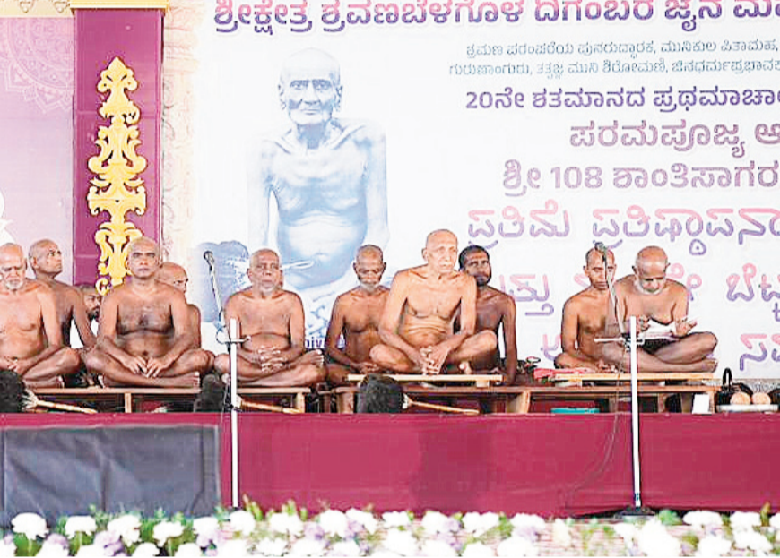
समारोह के माध्यम से, श्रवणबेलगोला स्थित दिगंबर जैन मठ ने न केवल एक महान संत को सम्मानित किया है, बल्कि आने वाली पीढ़ियों के लिए एक महत्वपूर्ण आध्यात्मिक ज्योति भी प्रज्वलित की है। उन्होंने कहा कि नवअनावृत प्रतिमा यहाँ आने वाले प्रत्येक व्यक्ति को सादगी, पवित्रता और