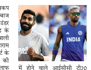
में होने वाले आईसीसी टी20 वर्ल्ड कप को देखते हुए अंधास को देखते हुए बेहद अहम रहेगी। ऐसे में माना जा रहा है कि बुमरा और पांड्या को टी20 सीरीज के लिए शामिल किया जाएगा। एकदिवसीय सीरीज में इन्हें आराम दिये जाने का कारण खिलाड़ियों का कार्यभार प्रबंधन भी है। जिससे कि खिलाड़ी विश्वकप तक पूरी तरह से फिट और तरोताजा हो सकें।