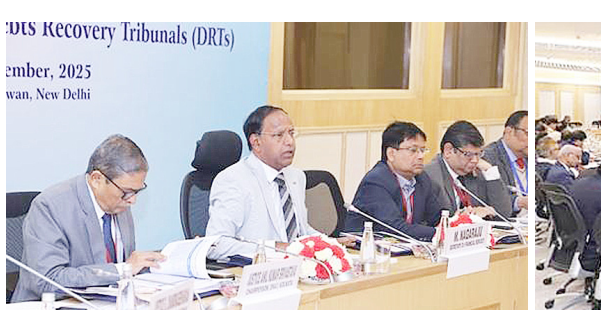
प्रकाश डाला, जिसमें अनिवार्य ई-फाइलिंग को अपनाया, वीडियो कॉन्फ्रेंसिंग का उपयोग, हाइब्रिड सुनवाई आदि शामिल हैं। बैठक में

सचिव ने अधिकरणों की प्रक्रियाओं में सुधार लाने के लिए विभाग द्वारा डिजिटलीकरण को बढ़ावा देने हेतु उच्च गुणवत्ता वाले ई-लर्निंग पाठ्यक्रम प्रदान करता है।