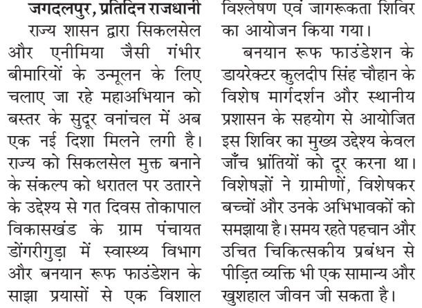
सिकलसेल मुक्त बस्तर का संकल्प, घर-घर जाकर जगाई जागरूकता