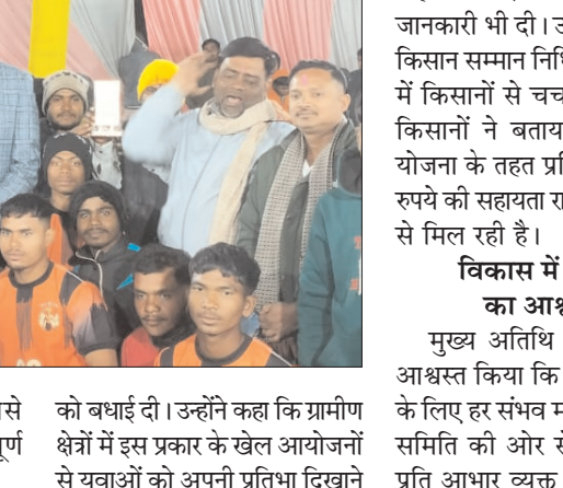
अतिथियों का किया गया स्वागत