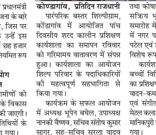
शरद कालीन प्रशिक्षण कार्यशाला का समापन, बच्चों को मिले प्रशस्ति पत्र