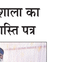
शरद कालीन प्रशिक्षण कार्यशाला का समापन, बच्चों को मिले प्रशस्ति पत्र