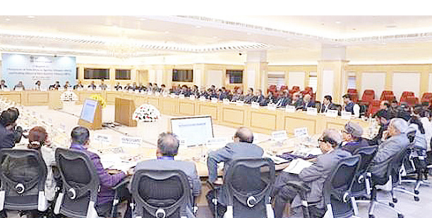
अपीलीय अधिकरणों में वसूली प्रक्रिया की प्रभावशीलता बढ़ाने के लिए व्यापक मुद्दों पर चर्चा हुई। इस चर्चा में शामिल थे:

डीआरटी के माध्यम से वसूली बढ़ाने के लिए बैंकों के सुदृढीकरण, निगरानी और पर्यवेक्षण तंत्र को और मजबूत करने हेतु उपाय; वसूली को अनुकूलित करने के लिए डीआरटी में उच्च मूल्य वाले मामलों पर विशेष ध्यान देना; विवादों के शीघ्र निपटारे के लिए वैकल्पिक समाधान तंत्र के रूप में लोक अदालतों का अधिकतम उपयोग; डीआरटी में निपटार में सुधार के लिए आगे की प्रक्रिया में सुधार;