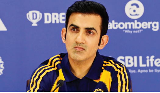
जब भारतीय टीम को घर पर टेस्ट सीरीज में सूपड़ा साफ झेलना पड़ा है। इससे पहले पिछले साल न्यूजीलैंड ने भी भारत को 0-3 से टेस्ट सीरीज में हराकर सभी को चौंका दिया था। इन नतीजों के बाद ही कोचिंग सेटअप में बदलाव की अटकलें तेज हो गई थीं और वीवीएस लक्ष्मण के नाम को गंभीर के संभावित विकल्प के तौर पर उछाला जाने लगा।

नई दिल्ली। घरेलू मैदान पर टेस्ट सीरीज में करारी हार के बाद भारतीय क्रिकेट टीम के मुख्य कोच गौतम गंभीर को लेकर तरह-तरह की चर्चाएं तेज हो गई थीं। एक मीडिया रिपोर्ट्स में यह दावा किया जा रहा था कि भारतीय क्रिकेट कंट्रोल बोर्ड गंभीर की जगह पूर्व दिग्गज बल्लेबाज वीवीएस लक्ष्मण को टेस्ट टीम की कोचिंग सौंपने पर विचार कर रहा है। इन अटकलों के बीच अब बीसीसीआई की ओर से आधिकारिक प्रतिक्रिया सामने आई है, जिसमें इन सभी खबरों को सिरे से खारिज कर दिया गया है। दरअसल, गौतम गंभीर की कोचिंग में भारत को दक्षिण अफ्रीका के खिलाफ घरेलू मैदान पर 0-2 से टेस्ट सीरीज में क्लोन स्वीप का सामना करना पड़ा। यह लगातार दूसरा साल है