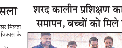
शरद कालीन प्रशिक्षण कार्यशाला का समापन, बच्चों को मिले प्रशस्ति पत्र