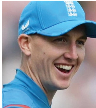
टी-20 वर्ल्ड कप के लिए इंग्लैंड की प्रोविजनल टीम : हैरी ब्रूक (कप्तान), रेहान अहमद, जोफ्रा आर्चर, टॉम बॅटन, जैकब बेथेल, जोस बटलर, सैम करन, लियम डॉसन, बेन डकेट, विल जैक्स, जेमी ओवरटन, आदिल राशिद, जोश टंग, ल्यूक वुड।

टीम में जोस बटलर, सैम करन, फिल साल्ट और आदिल राशिद जैसे सीनियर खिलाड़ियों को चुना गया है। तेज गेंदबाज जोफ्रा आर्चर को वर्ल्ड कप टीम में शामिल किया गया है, हालांकि वे श्रीलंका दौरे पर नहीं जाएंगे।