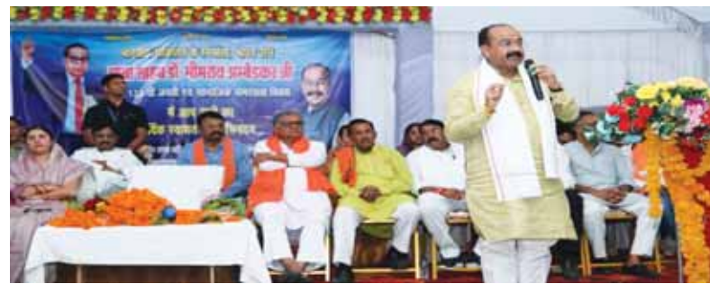
किसानों को लाभ मिलेगा।

उप मुख्यमंत्री एवं स्थानीय विधायक श्री अरुण साव ने लोरमी विधानसभा क्षेत्र के नवलपुर में मुख्यमंत्री विद्युत अधोसंरचना विकास योजना के तहत सब स्टेशन क्षमता विस्तार का लोकार्पण किया। इस कार्य से क्षेत्र के 10 गांवों में लो वोल्टेज और ओवरलोडिंग की समस्या दूर होगी। उन्होंने बताया कि सब स्टेशन की क्षमता 3.0 एमवीए से बढ़ाकर 5 एमवीए कर दी गई है, जिससे 6500 उपभोक्ताओं और 3500 कृषि पंप धारक