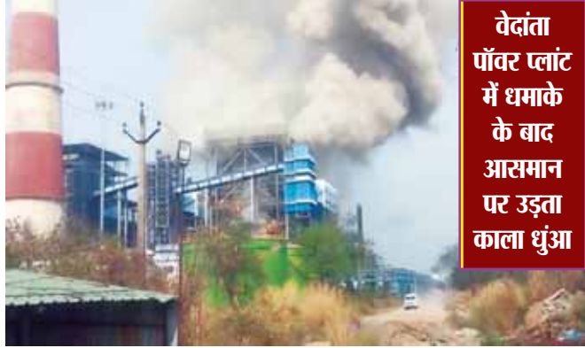
वेदांता पावर प्लांट में धमाके के बाद आसमान पर उड़ता काला धुआं