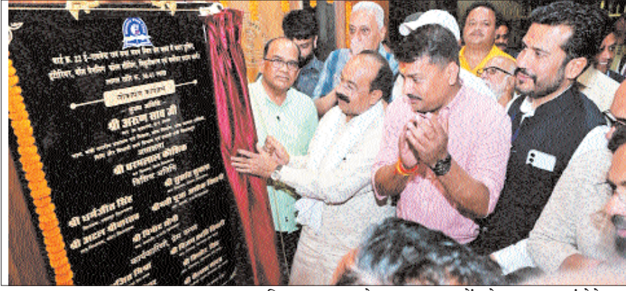
बिलासपुर, प्रतिदिन राजधानी

बिलासपुर प्रेस क्लब के नवनिर्मित और सुसज्जित भवन का लोकार्पण उपमुख्यमंत्री अरुण साव ने किया। लगभग 31 लाख रुपये की लागत से नगरीय