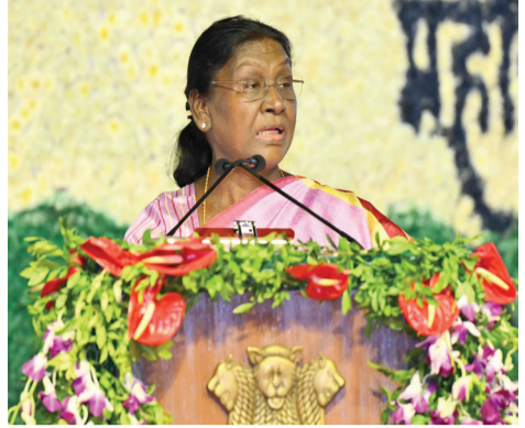
वर्षों के छात्रों के हितों की रक्षा के लिए प्रारंभिक किए गए हैं। इन हाशिए पर रहने

राष्ट्रपति ने कहा कि बाबासाहेब ने हमेशा शिक्षा के महत्व पर बल दिया। हमारे संविधान में शिक्षा को मौलिक अधिकार का दर्जा दिया गया है और उच्च शिक्षण संस्थानों में हाशिए पर रहने वाले