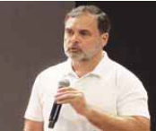
राहुल गांधी ने एकस पोस्ट में लिखा कि किसी पिते ने करज दिया, किसी मां ने गहने बेचे और लाखों बच्चों ने रात-रात भर जागकर पढ़ाई की, लेकिन बदले में उन्हें मिला पेपर लीक और भ्रष्टाचार। यह केवल नकामी नहीं बल्कि युवाओं के भविष्य के साथ अपराध है।

कांग्रेस नेता राहुल गांधी ने नीट-यूजी 2026 परीक्षा रद्द होने पर केंद्र सरकार पर निशाना साधते हुए कहा कि 22 लाख से अधिक छात्रों की मेहनत, लगन और सपनों को भ्रष्ट व्यवस्था ने कुचाल दिया है। उन्होंने आरोप लगाया कि पेपर लीक, सरकारी लापरवाही और शिक्षा में संगठित भ्रष्टाचार ने युवाओं का भविष्य खतरे में डाल दिया है।