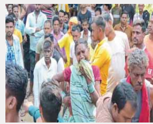
जांजगीर-वंशा (प्रतिदिन राजधानी)

छत्तीसगढ़ के जांजगीर-वंशा जिले के भनतरा गांव में विल दहला देने वाली वारदात सामने आई है। जहां गांव में एक ही परिवार के चार लोगों की धारदार हथियार से हत्या कर दी गई। मृतकों में दो पुरुष और दो महिलाएं शामिल हैं। घटना के बाद पूरे इलाके में सनसनी फैल गई है। पुलिस से प्राप्त जानकारी के अनुसार, परिवार के सदस्य निर्माणधीन मकान में खाट पर सो रहे थे। सुबह दस रात अज्ञात हमलावर ने उन पर धारदार हथियार से हमला कर दिया। गुरुवार सुबह जब निर्माण कार्य के लिए मिस्त्री मौके पर पहुंचा, तब चारों की लाशें खून से लथपथ हालत में मिली।