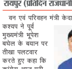
उन्होंने कहा कि भाजपा सरकार में हर जनसुनवाई और प्रशासनिक प्रक्रिया का नुकसान के दावों ने हो रही है। यदि किसी तरह पर शिकायत आती है तो उसकी जांच की जायगी।