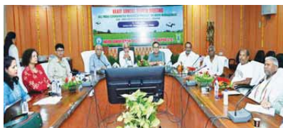
नई तकनीकों के उपयोग, प्रभावी खरपतवार नियंत्रण उपायों तथा किसानों तक उचित तकनीक पहुंचाने के विभिन्न पहलुओं पर अपने विचार साझा किए। इस दौरान दिवसीय समीक्षा बैठक में कृषि वैज्ञानिकों ने विभिन्न फसलों को हानि पहुंचाने वाले खरपतवारों के प्रभावी नियंत्रण की विभिन्न विधियों पर सारगर्भित चर्चा की तथा फसलों को इनसे होने वाले नुकसान को न्यूनतम करने हेतु मंथन किया। इस दौरान विभिन्न रासायनिक खरपतवारनाशकों से सिद्धि, जल एवं पर्यावरण पर पड़ने वाले दुष्प्रभावों पर भी चर्चा की गई और इसे रोकने के उपायों का भी विचार-विमर्श किया गया। हानिकारक हर्बिसाइड के उपयोग को सीमित करते हुए खरपतवार प्रबंधन की वैकल्पिक विधियों को प्रोत्साहन देने पर जोर दिया गया।

इंदिरा गांधी कृषि विश्वविद्यालय, रायपुर में आयोजित अखिल भारतीय समन्वित खरपतवार प्रबंधन अनुसंधान परिषद की त्रि-दिवसीय 33वीं वार्षिक समीक्षा बैठक का आज यहां समापन हुआ। बैठक के तृतीय दिवस में उद्योग जगत से जुड़े प्रतिनिधियों एवं विशेषज्ञों के साथ विशेष संवाद सत्र आयोजित किया गया। इस दौरान खरपतवार प्रबंधन से संबंधित आधुनिक तकनीकों, कृषि उपयोगी उपकरणों, नवाचारों एवं अनुसंधान आवश्यकताओं पर विस्तृत चर्चा की गई। उद्योग प्रतिनिधियों ने कृषि क्षेत्र में नई तकनीकों के उपयोग, प्रभावी खरपतवार नियंत्रण उपायों तथा किसानों तक उचित तकनीक पहुंचाने के विभिन्न पहलुओं पर अपने विचार साझा किए। इस दौरान दिवसीय समीक्षा बैठक में कृषि वैज्ञानिकों ने विभिन्न फसलों को हानि पहुंचाने वाले खरपतवारों के प्रभावी नियंत्रण की विभिन्न विधियों पर सारगर्भित चर्चा की तथा फसलों को इनसे होने वाले नुकसान को न्यूनतम करने हेतु मंथन किया। इस दौरान विभिन्न रासायनिक खरपतवारनाशकों से सिद्धि, जल एवं पर्यावरण पर पड़ने वाले दुष्प्रभावों पर भी चर्चा की गई और इसे रोकने के उपायों का भी विचार-विमर्श किया गया। हानिकारक हर्बिसाइड के उपयोग को सीमित करते हुए खरपतवार प्रबंधन की वैकल्पिक विधियों को प्रोत्साहन देने पर जोर दिया गया।