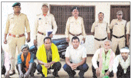
रायपुर, प्रतिदिन राजधानी

बलरामपुर जिले के रायपुर वन परिक्षेत्र अंतर्गत अंबिकापुर चिलमा वनखण्ड में बड़े पैमाने पर अवैध पेड़ कटाई का मामला सामने आया है। वन विभाग ने आमत