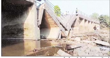
सरगुजा, प्रतिदिन राजधानी

उन्होंने कहा कि न्यायिक आधारभूत संरचना को लगातार मजबूत किए जाने से आम लोगों को बेहतर वातावरण में त्वरित न्याय उपलब्ध कराने की दिशा में बड़ा सुधार होगा। न्यायालय परिसरों में सुविधाओं से आम लोगों को बेहतर वातावरण में त्वरित न्याय उपलब्ध कराने की दिशा में बड़ा सुधार होगा। न्यायालय परिसरों में सुविधाओं से आम लोगों को बेहतर वातावरण में त्वरित न्याय उपलब्ध कराने की दिशा में बड़ा सुधार होगा। न्यायालय परिसरों में सुविधाओं से आम लोगों को बेहतर वातावरण में त्वरित न्याय उपलब्ध कराने की दिशा में बड़ा सुधार होगा।