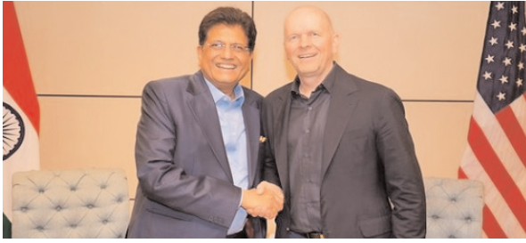
अमेरिकी-भारत रणनीतिक साझेदारी मंच (यूएसआईएसएफ) के सहयोग से किया था।

व्यापार जगत के दिग्गजों के साथ बातचीत के दौरान यह जानकारी दी। केंद्रीय वाणिज्य और उद्योग मंत्री ने 'एक्स' पोस्ट पर बताया कि उन्होंने न्यूयॉर्क में एक गोलेमज बैठक के दौरान 50 से ज्यादा वैश्विक व्यापार और उद्योग जगत के नेताओं के साथ बातचीत की। उन्होंने बताया कि इस कार्यक्रम का आयोजन अमेरिका के न्यूयॉर्क में स्थित भारत के महावाणिज्य दूतावास ने