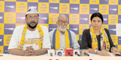
रायपुर (प्रतिदिन राजधानी)

आजादी के इतने वर्षों बाद भी जनता को पानी तक न दे पाना सरकार की सबसे बड़ी विफलता — आम आदमी पार्टी