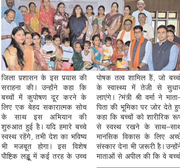
जिला प्रशासन के इस प्रयास की सराहना की। उन्होंने कहा कि बच्चों को कुपोषण दूर करने के लिए एक बेहद सकारात्मक सोच के साथ इस अभियान की शुरुआत हुई है।

रायपुर, प्रतिदिन राजधानी बलौदाबाजार-भाटापारा जिले से कुपोषण को जड़ से मिटाने के लिए जिला प्रशासन द्वारा एक अन्वैी पहल की शुरुआत की गई है।