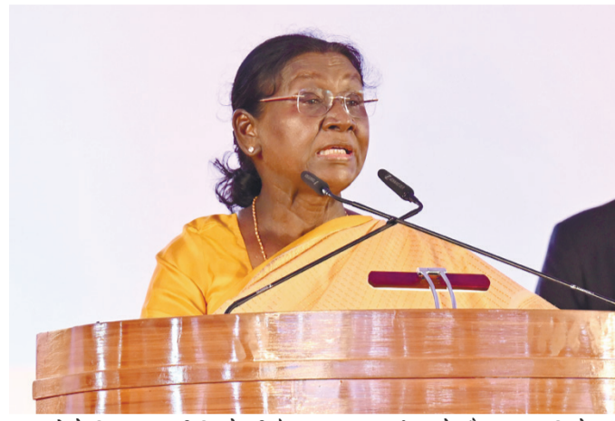
सरकारों के लिए एक बड़ी जिम्मेदारी है। कार्यक्रम के दौरान राष्ट्रपति ने मध्य

लिए एक बड़ी उपलब्धि करार दिया। राष्ट्रपति द्रौपदी मुर्मू ने सभा को संबोधित करते हुए कहा कि नवजात शिशुओं से लेकर 40 वर्ष तक की आयु के सात करोड़ लोगों की स्क्रीनिंग करना कोई सामान्य कार्य नहीं है। यह भारत की दृढ़ इच्छाशक्ति का परिणाम है कि आज हम आनुवंशिक रोगों की पहचान में विश्व का नेतृत्व कर रहे हैं। मिशन मोड में किए गए इस कार्य के चलते अब तक लगभग 2.5 लाख मरीजों और 20 लाख से अधिक वाहकों (कैरियर) की पहचान की जा चुकी है। राष्ट्रपति ने जोर देकर कहा कि इतनी बड़ी संख्या में वाहकों की पहचान होने के बाद अब उनकी उचित देखभाल और स्वास्थ्य प्रबंधन केंद्र व राज्य