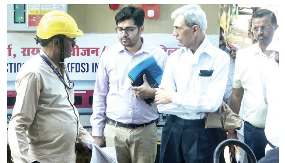
फि, रायपुर रेल मंडल में (FDS) IN