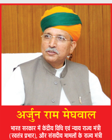
अर्जुन राम मेघवाल

भारत सरकार में केंद्रीय विधि एवं न्याय राज्य मंत्री (स्वतंत्र प्रभार), और संसदीय मामलों के राज्य मंत्री