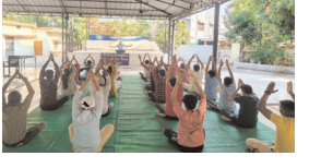
रायपुर (प्रतिदिन राजधानी)

अंतरराष्ट्रीय योग दिवस पर संकल्प नशा मुक्ति केंद्र में हुआ योगाभ्यास